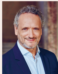
LOUIS LANGRÉE DIRECTEUR DE L'OPÉRA-COMIQUE

Merci à vous toutes et tous de nous accompagner dans cette nouvelle saison et de nous aider à toujours mieux partager la magie de l'Opéra-Comique !